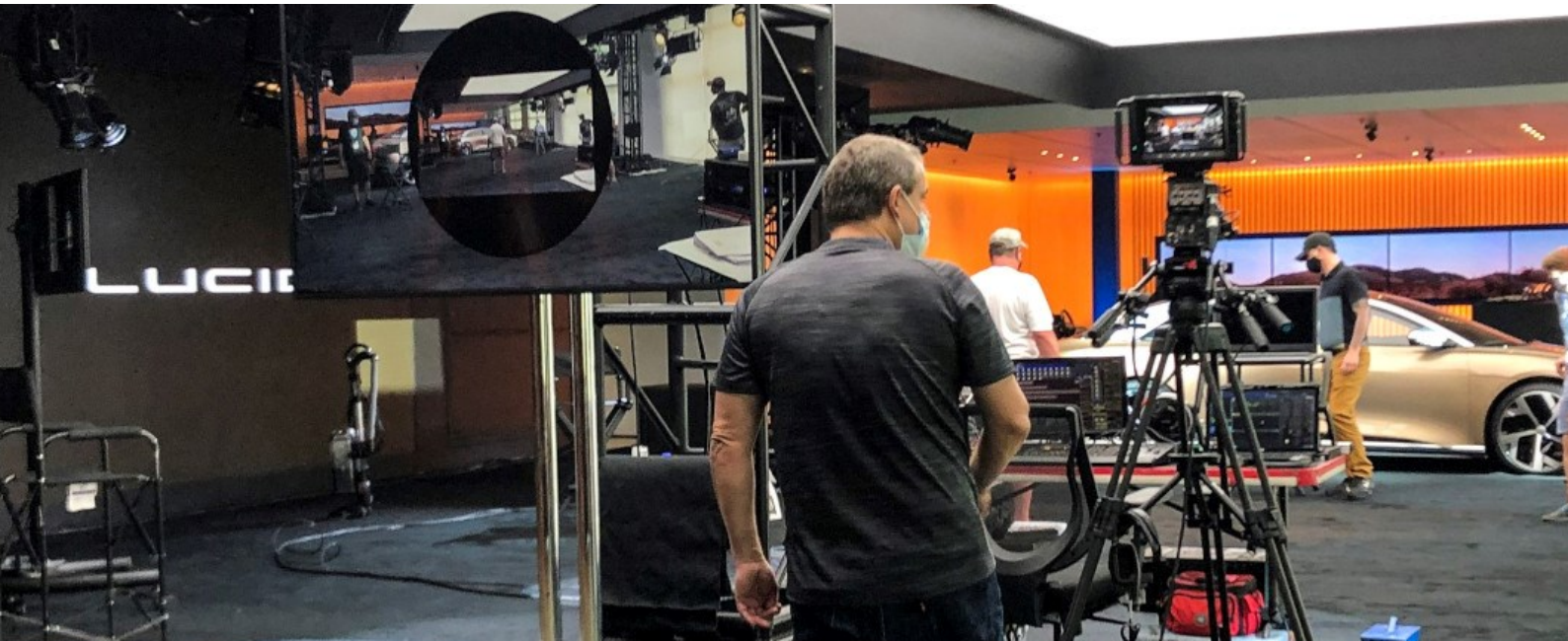
MC 2 | "The Lucid Air"

In der Division "Live Marketing Solutions" (LMS) wurden im Geschäftsjahr 1'124 Projekte betreut, davon 130 in der Schweiz und 826 in den USA. Das sind anzahlmässig rund 30 % der im Vorjahr betreuten Projekte.