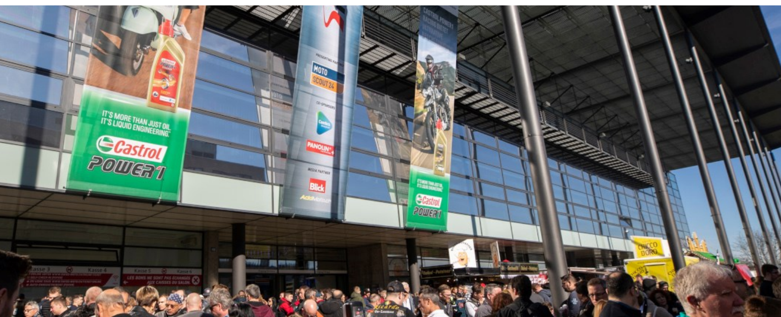
Messe Zürich | SWISS-MOTO

In der Messe Basel konnte von den geplanten sieben Eigenmessen nur die Swissbau durchgeführt werden – Details zu den Eigenmessen siehe oben. Von den geplanten neun Gastmessen konnte nur die auf Oktober verschobene blickfang stattfinden. Alle anderen Gastmessen mussten abgesagt werden, so unter anderem die AUTO/MOBIL Basel, die FANTASY Basel und die Basler Berufs- und Bildungsmesse. Auch im Bereich der Hallenvermietungen mussten die meisten Events abgesagt werden. Während knapp drei Monaten konnten Teile der Halle 2 dem Theater Basel als Probe-Lokalität zur Verfügung gestellt werden. Die Kartbahn in der Halle 1 – die grösste Indoor-Kartbahn in der Schweiz – musste nach wenigen Wochen den Betrieb schliessen.