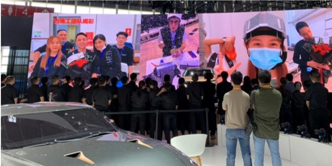
Nissan | Beijing Motor Show