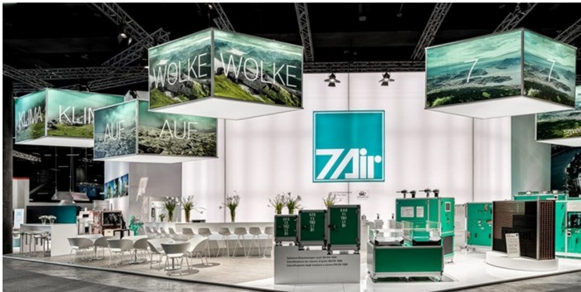
7AIR | Swissbau 2020