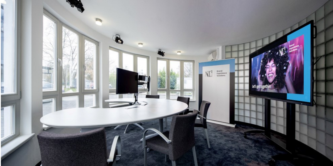
MC 2 Europe | Studio für Videocalls