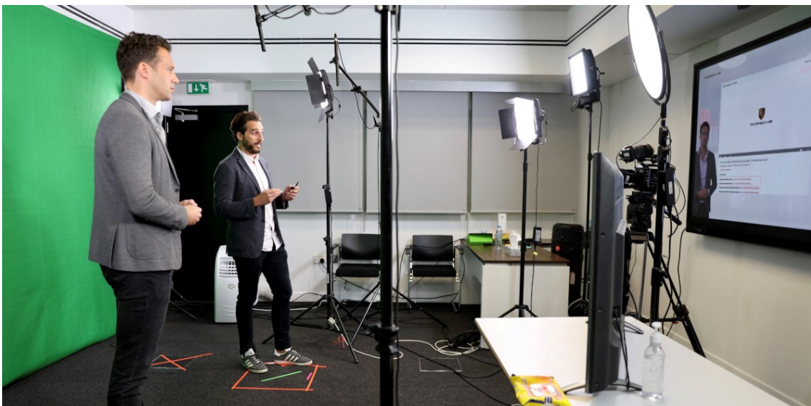
Porsche | Virtual Summit