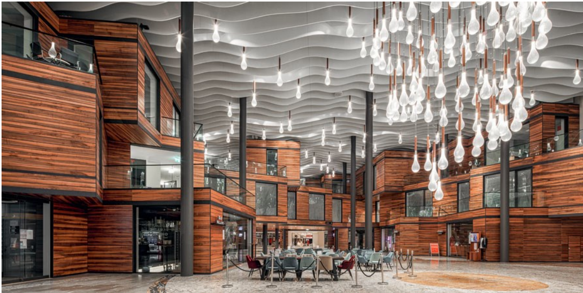
Expomobilia – Stücki

Es war selbst für die erfahrenen Projektleiter von Expomobilia ein aussergewöhnliches Hochbauprojekt: der Umbau des Stücki Einkaufszentrums der Swiss Prime Site AG in Basel zum Stücki «Village», einer attraktiven und vielseitigen Begegnungszone mit Einkaufs- und Erlebnisangeboten, Restaurants, Arztpraxen und Coworking-Spaces. Expomobilia wurde von S+B Baumanagement mit dem dreigeschossigen Einbau, der Tragstruktur und der kompletten Fassade beauftragt. Der würfelförmige, verschachtelte Hochbau auf drei Stockwerken entstand nach dem Konzept von Diener und Diener Architekten.