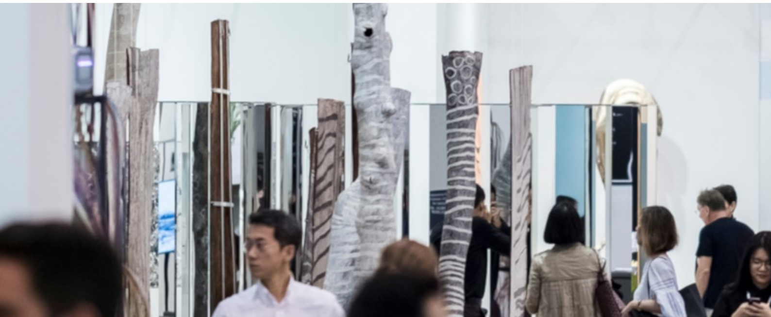
Art Basel in Hong Kong

Die Art Basel Shows in Basel, Miami Beach und Hong Kong und die Premiere der Art Basel Cities in Buenos Aires, die erste Masterpiece London mit Beteiligung der MCH Group, die Lancierung von MCH Global als neue Full Service Agentur im Bereich Experience Marketing sowie zahlreiche Grossaufträge im Messe- und Eventbau zählen nicht nur zu den Höhepunkten 2018, sondern spielen auch in der notwendigen Priorisierung der strategischen Initiativen eine wichtige Rolle.