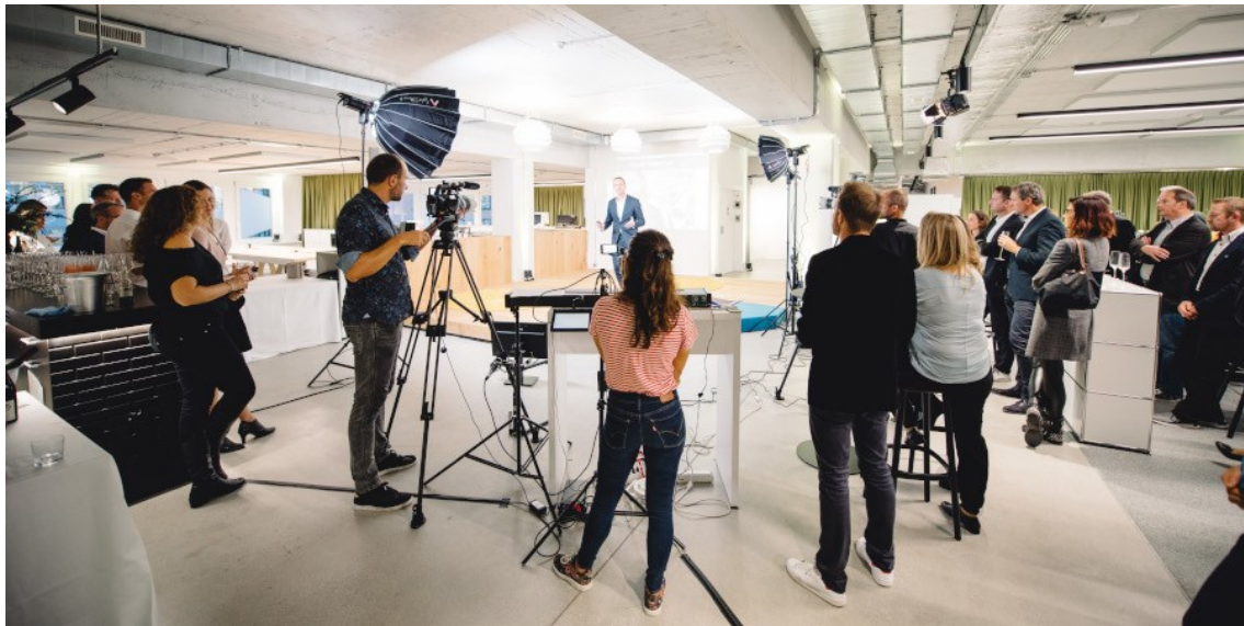
MCH Global - Launch Event

Am 1. Dezember war es soweit: MCH Global startete als neu formierte Full Service Agentur für Experience Marketing auch im Schweizer Markt. Das Angebot von MCH Global reicht von Strategie über Konzeption bis hin zur Umsetzung. Die Marke Rufener wurde im Rahmen der Neulancierung in den Brand MCH Global integriert.