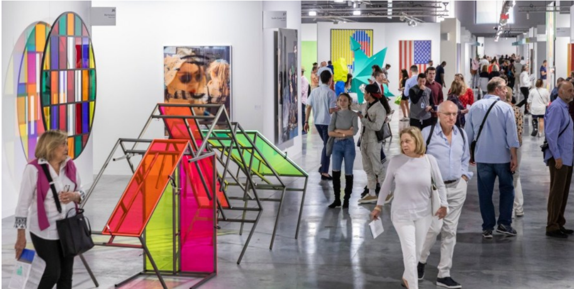
Art Basel in Miami Beach

Herausragende Präsentationen der weltweit führenden Galerien, mehr als 255'0000 Besucher, hohe Umsätze in allen Marktsegmenten. Die drei Shows in Basel, Miami Beach und Hong Kong bescherten der Art Basel erneut ein erfolgreiches Jahr und festigten ihre Stellung als führende Plattform des globalen Kunstmarktes.