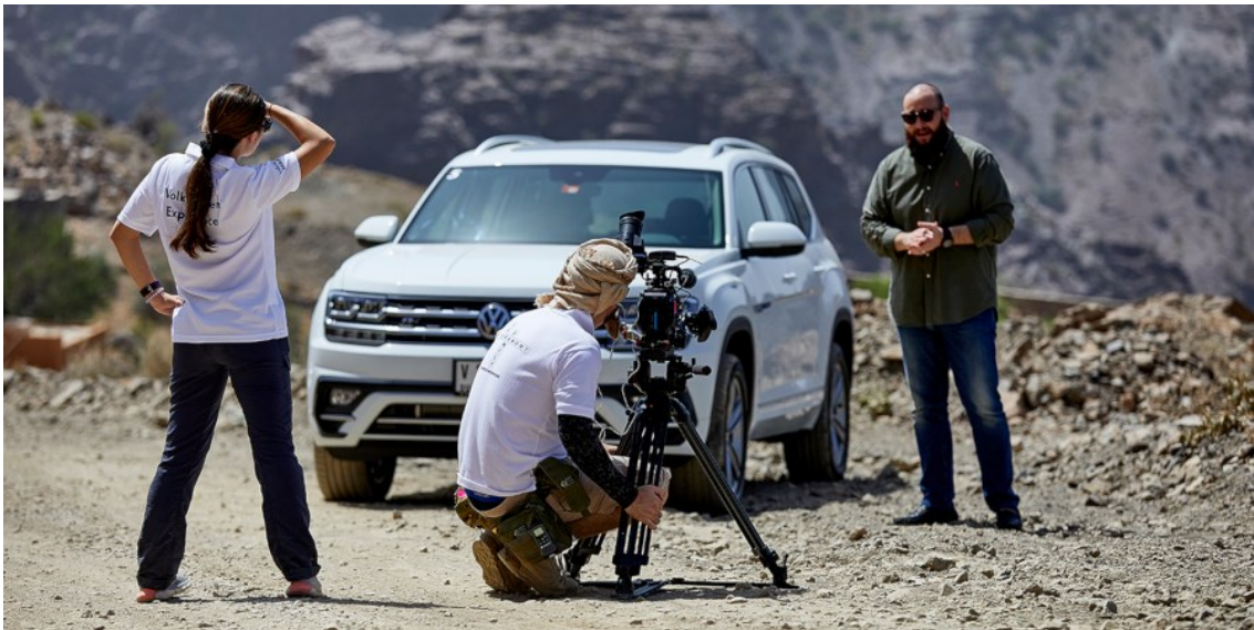
MCH Global - Volkswagen

Insgesamt sind rund 50 Kolleginnen und Kollegen an den Standorten Zürich, Dubai, Shanghai, Hong Kong und Los Angeles für MCH Global tätig.