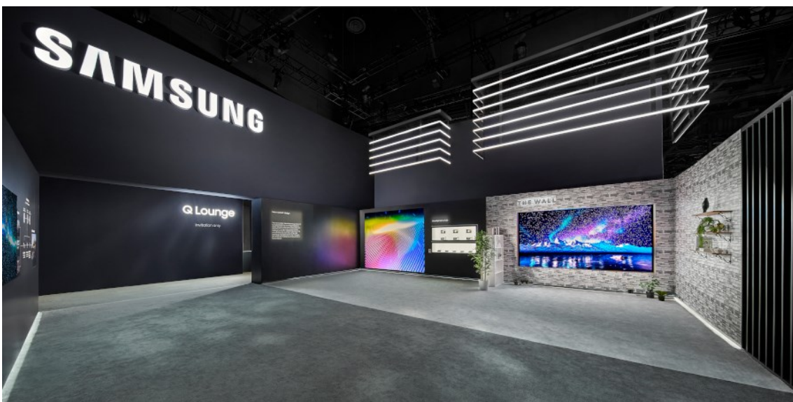
MC 2 – Samsung – CES