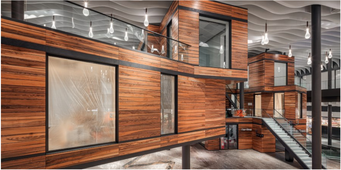
Expomobilia – Stücki