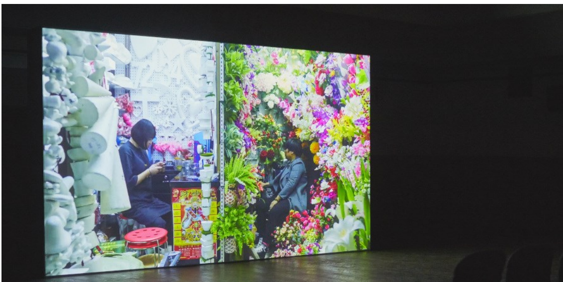
Art Basel Cities - Buenos Aires

Die Show in Miami Beach im Dezember fand erstmals im renovierten Miami Beach Convention Center (MBCC) mit geräumigerem Showlayout und neuem Design statt, was bei Ausstellern und Besuchern hervorragend ankam. Im ebenfalls neu designten Grand Ballroom konnte erstmals eine gross angelegte Performance-Installation stattfinden.