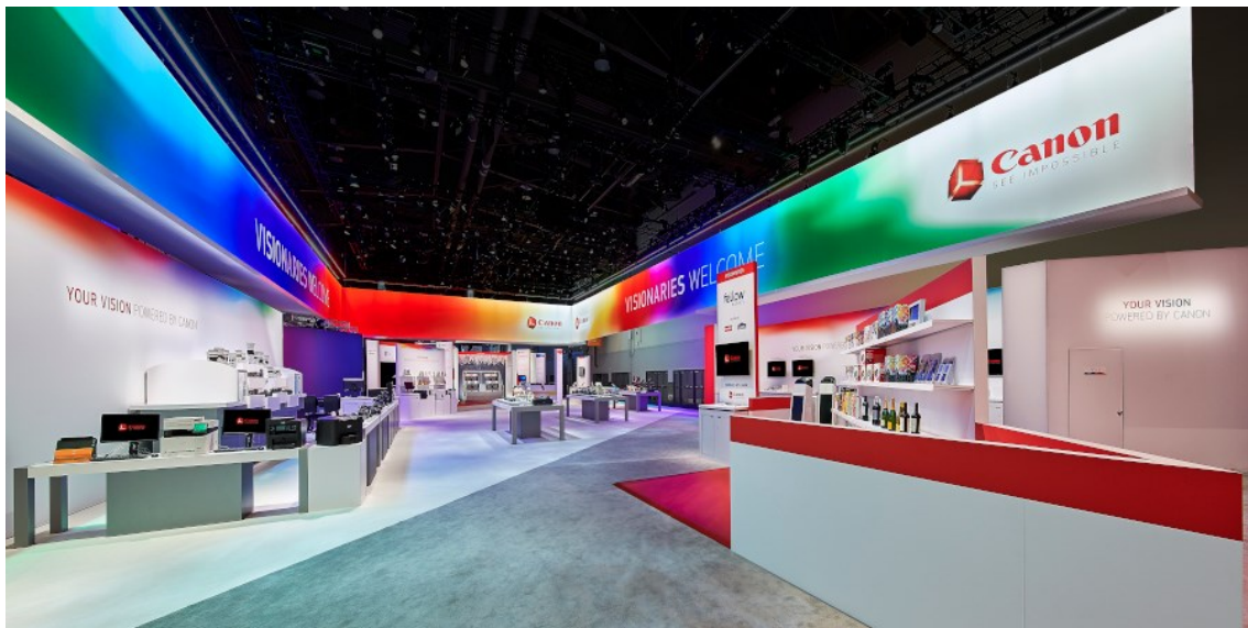
MC 2 – Canon – CES

Weitere Highlights: Die Stände von Canon USA und Pioneer, bei welchen MC 2 für das Design, die Fertigung und den Aufbau verantwortlich war. Zu den anderen Kunden von MC 2 an der CES 2018 zählten Sony, Acer, Coway, Otter, iDevices, OOMA, Ring, Sports Innovation Lab und Cambridge.